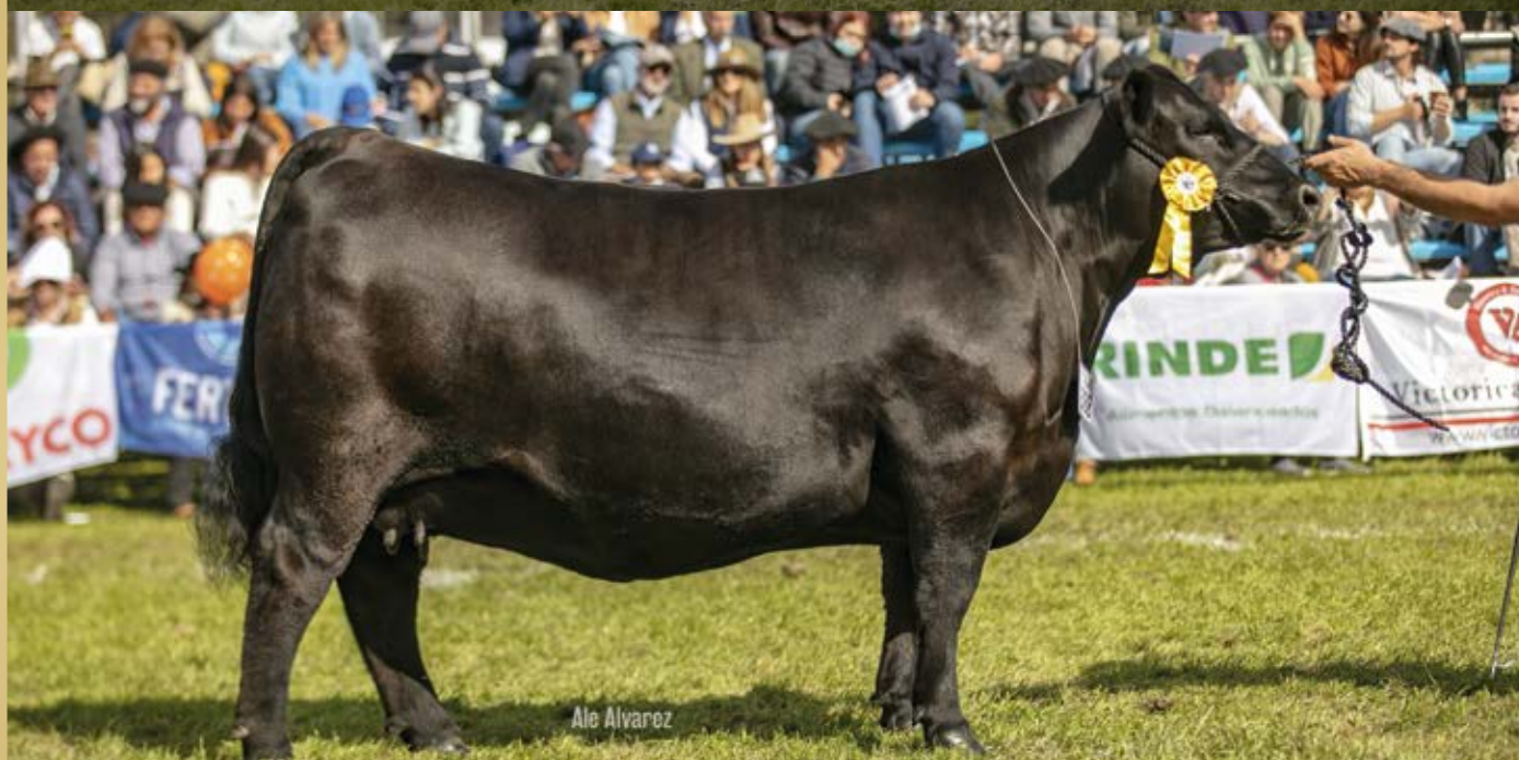
CAMPEONA VAQUILLONA MENOR PRADO 2022 - PI 618 TE "SEGURO x 5628 TE"